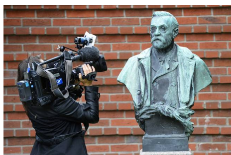
一位摄影师在拍摄诺贝尔雕像

摆脱“人质情结”才会看到事实真相。法轮功学员的“4·25”上访和他们的讲真相，是在维护做好人、讲真话的基本权利，是在维护每一个中国人的合法权利。（文／华云）◇