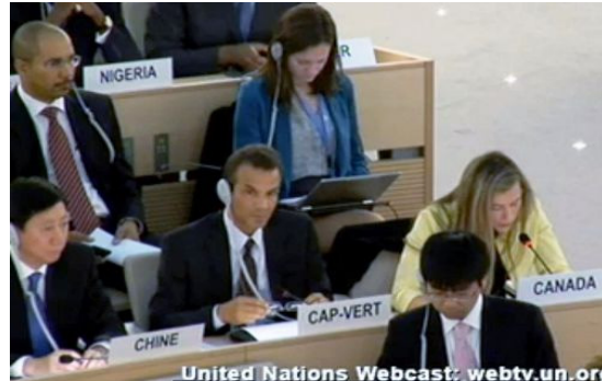
加拿大代表（右一）在联合国会议上再次提出中共迫害法轮功等问题。右图：加拿大宗教自由办公室大使安德鲁·班尼特先生和法轮功学员合影。

今年六月七日，加拿大主流媒体《环球邮报》刊登文章《新的宗教自由监督面临艰苦战斗》，披露今年二月，加拿大总理在宗教自由办公室正式成立时，谴责了中共的宗教迫害，包括对法轮功的迫害。《环球邮报》引用宗教自由办公室大使班尼特的话说：“我们将继续在宗教迫害方面