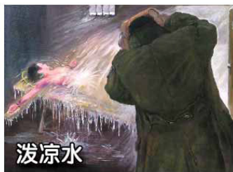
法轮功学员遭受的部分酷刑