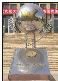
图左：中共酷刑折磨法轮功学员，同时掩盖罪行。图中：国际获奖纪录片《伪火》揭露了“天安门自焚”假案是中共导演的。中宣部制造了大量假新闻煽动民众仇恨，为中共迫害法轮功铺路。图右：“宪法顶个球”——当年的陕西省西北政法大学雕塑。中共迫害法轮功无任何法律依据。