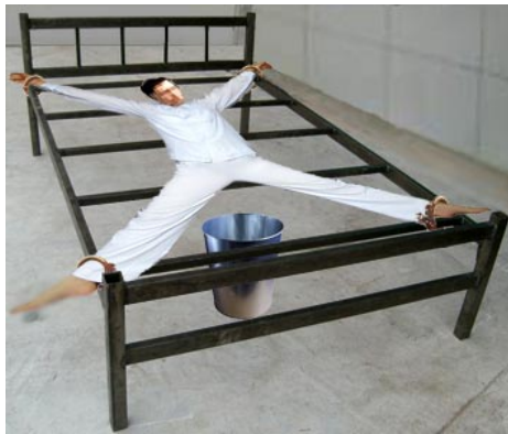
酷刑示意图：死人床

他们都是戴着手铐脚镣进来的。进来后每天 24 小时被大字型地铐在床上，只有吃饭、上厕所暂时把铐子打开，完事立刻铐上。每屋四人，四张床，一个角一张。四名法轮功学员就这样整日被铐在床上。半夜一、二点钟经常听到凄惨的叫声：“警察杀人了！”之后就听到被子捂嘴的声音，