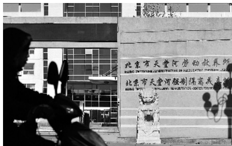
天堂河劳教所门口仍挂着劳动教养所的牌子

释放。不过，北京市劳教局工作人员表示，劳教局尚未摘牌，什么时候摘牌，摘牌后叫什么名称，都还不清楚。