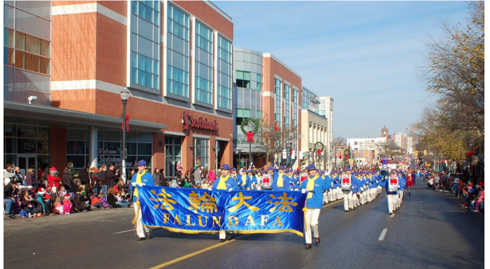
二零一三年十一月十六日，多伦多天国乐团滑铁卢圣诞大游行受欢迎

南京的李先生说：“海外的传媒很自由，法轮功的消息我们都了解，法轮功弘传世界我们都知道。只有中共对他们进行残酷的迫害。但是看看王立军、薄熙来的下场，其实中共也该知道自己的结局了。”