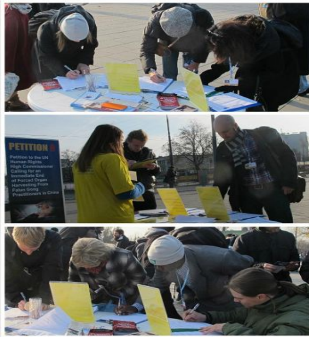
图：参加会议的各国代表纷纷在征签簿上签名

十一月十九日开始, 波兰法轮功学员在会议地点-华沙国家体育场外一主要通道旁摆放多语种法轮功真相展板, 并向进出会场的全球多国政府代表发放英文法轮功真相传单和由“反强摘器官医生协会”(Doctors Against Forced Organ Harvesting, 简称 DAFOH) 发起