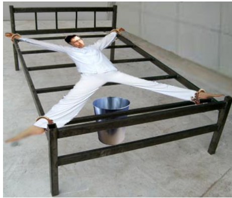
酷刑示意图：死人床

他们都是戴着手铐脚镣进来的。进来后每天 24 小时被大字型地铐在床上，只有吃饭、上厕所暂时把铐子打开，完事立刻铐上。每屋四人，四张床，一个角一张。四名法轮功学员就这样整日被铐在床上。半夜一、二点钟经常听到凄惨的叫声：“警察杀人了！”之后就听到被子捂嘴的声音，