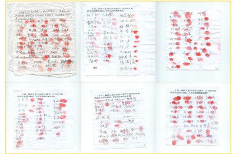
图:湖北 237 名民众签名、按手印要求释放戴美霞女士。

二零一三年三月二十五日上午,黄梅县法院对戴美霞非法开庭,来自北京、广州两位正义律师从法律角度阐明《宪法》赋予公民信仰、言论自由,戴美霞信仰法轮功合法,要求法庭无罪释放。庭审中,一法官当场昏