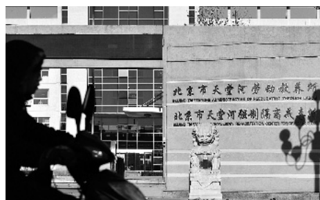
天堂河劳教所门口仍挂着劳动教养所的牌子

释放。不过，北京市劳教局工作人员表示，劳教局尚未摘牌，什么时候摘牌，摘牌后叫什么名称，都还不清楚。