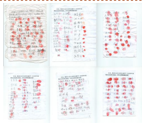
湖北 237 名民众签名、按手印要求释放戴美霞女士。