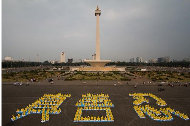
图: 法轮功学员在雅加达国家博物馆西侧排字: “真善忍”

正值印尼法轮大法修炼心得交流会召开前, 来自印尼各地的法轮功学员们参加了这一系列活动。十一日, 学员们在使领馆门前静坐抗议, 谴责中共的暴行。第二天, 数百名法轮功学员来到雅加达繁华的市中心开