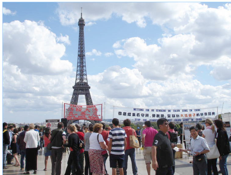
图: 巴黎埃菲尔铁塔下, 法轮功学员常年坚持讲真相, 帮助中国游客三退。