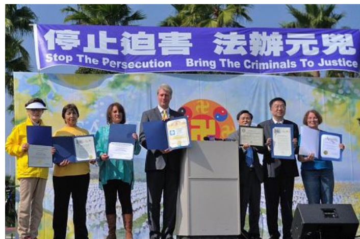
■ 洛杉矶政要为法轮功学员颁发褒奖

2013年10月20日，来自世界各地的约两千名法轮功学员汇集于美国加州洛杉矶长滩的玛丽娜·格林公园，举行大型集会，揭露中共活摘法轮功学员器官的反人类罪行，同时呼吁制止迫害，要求法办元凶，获得长滩市副市长、议员等当地政要的支持。