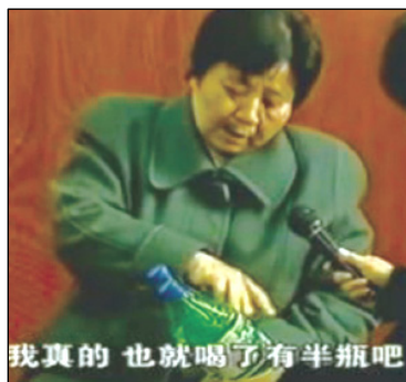
■ 央视镜头中刘大妈用手比划喝了多少汽油。

在“天安门自焚假案”中还有违背常识的事情，诸如：自焚小女孩“气管切开能唱歌”，王进东的“头发、眉毛烧不着”等等。