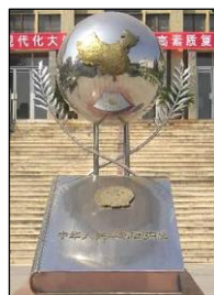
图左：中共酷刑折磨法轮功学员，同时掩盖罪行。图中：国际获奖纪录片《伪火》揭露了“天安门自焚”假案是中共导演的。中宣部制造了大量假新闻煽动民众仇恨，为中共迫害法轮功铺路。图右：“宪法顶个球”——当年的陕西省西北政法大学雕塑。中共迫害法轮功无任何法律依据。