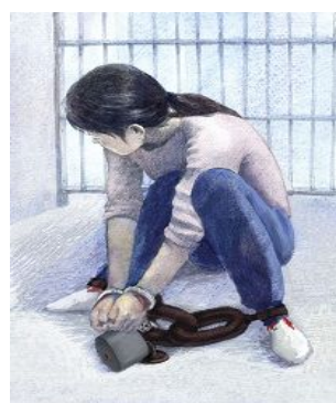
中共酷刑：手铐脚镣