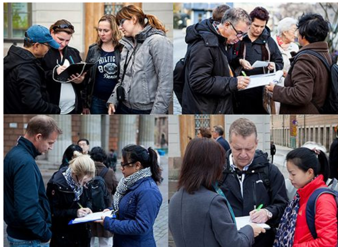
了解真相的人们纷纷签名支持制止中共活摘法轮功学员器官。