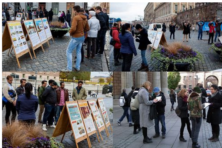
人们在展板前了解法轮功真相

使用海外电子信箱向 freeget.ip@gmail.com 发送一封邮件,内容任意,主题任意(不能空白),大约十分钟后会收到一个网页地址,打开网页后,请点击下方绿色,Download 按钮,下载翻墙软件,双击下载的软件即可突破网络封锁,安全、自由地浏览更多的真实资讯。