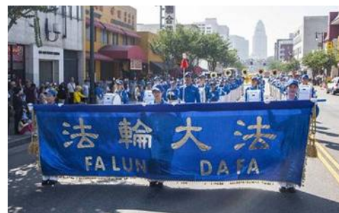
图: 气势雄壮的法轮功游行队伍

•格林公园集会、炼功,一部份在洛杉矶中国城举行游行向世人展现法轮大法真、善、忍的美好,揭露中共恶党对法轮功的残酷迫害。游行队伍传递的慈悲信息与浩然正气震撼沿途各族裔观众的心灵。人们脸上洋溢着兴奋和喜悦,或向游行队伍竖起大拇指,或和着天国乐团的乐曲节拍踏步,或接过法轮功真相资料阅读,或拍下这殊胜的场景作为纪念。◇