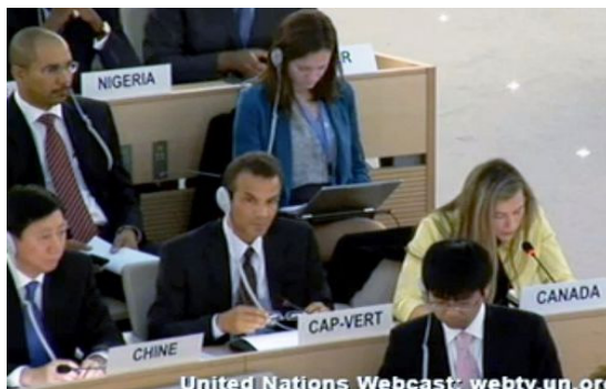
加拿大代表（右一）在联合国会议上再次提出中共迫害法轮功等问题。右图：加拿大宗教自由办公室大使安德鲁·班尼特先生和法轮功学员合影。

今年六月七日，加拿大主流媒体《环球邮报》刊登文章《新的宗教自由监督面临艰苦战斗》，披露今年二月，加拿大总理在宗教自由办公室正式成立时，谴责了中共的宗教迫害，包括对法轮功的迫害。《环球邮报》引用宗教自由办公室大使班尼特的话说：“我们将继续在宗教迫害方面