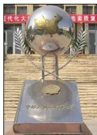
图左：中共酷刑折磨法轮功学员，同时掩盖罪行。图中：国际获奖纪录片《伪火》揭露了“天安门自焚”假案是中共导演的。中宣部制造了大量假新闻煽动民众仇恨，为中共迫害法轮功铺路。图右：“宪法顶个球”——当年的陕西省西北政法大学雕塑。中共迫害法轮功无任何法律依据。