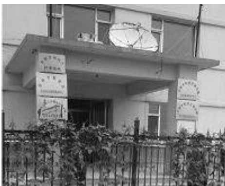
吉林市沙河子洗脑班

的一个社会福利院里，楼门前挂着“吉林市残疾人托养基地”等牌子。据知情人讲：这个福利院的三楼已经卖给了吉林市“610”，对外称“吉林市法制教育培训基地”，其实就是“610”迫害法轮功学员的黑监狱。吉林市“610”经常指使、胁迫各区公安分局，乡镇、街道派出所，社区