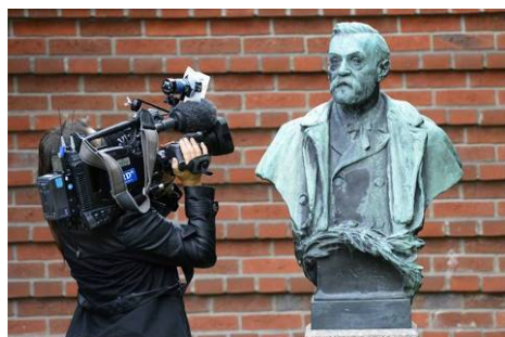
一位摄影师在拍摄诺贝尔雕像

摆脱“人质情结”才会看到事实真相。法轮功学员的“4·25”上访和他们的讲真相，是在维护做好人、讲真话的基本权利，是在维护每一个中国人的合法权利。（文／华云）◇