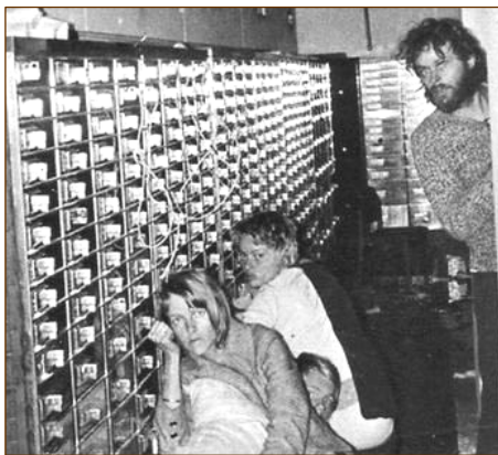
1973 年的斯德哥尔摩银行抢劫事件

在国际社会里，只有个别遭挟持者会患上“斯德哥尔摩综合症”。而长期生活在共产社会里的人，却普遍患有此种心理疾病。