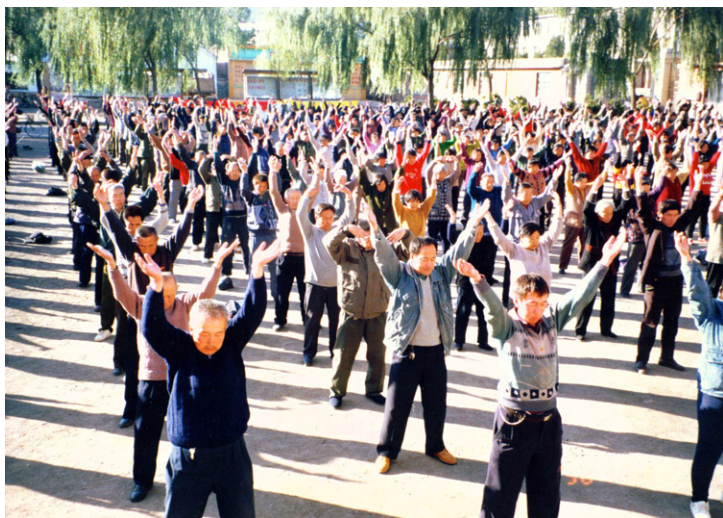
99年迫害前，辽宁凌源市大法弟子集体炼功

三十多年的佛教净土修炼中，大姐陆续帮助过不少人，但从来不允许别人把她的事情跟其他人讲，也坚决不受任何人的钱财。她曾开玩笑地说：如果当时收钱，可能早就是百万富翁了！这也证明，一个真正修