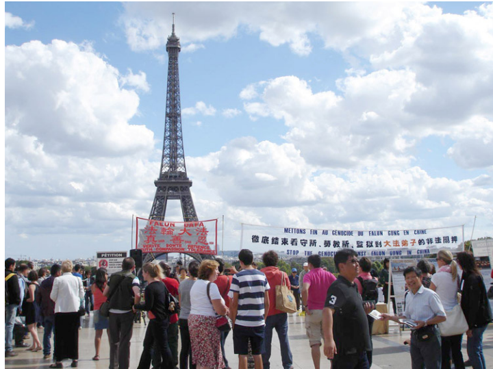
巴黎埃菲尔铁塔下，法轮功学员常年坚持讲真相，帮助中国游客“三退”

最近，来欧洲景点的中国大陆游客，最热的话题就是雾霾。他们说，在欧洲转了几个国家，都没见到雾霾天，而且秋高气爽，气候宜人，特别是喘气舒畅。大陆游客说：“看来，雾霾天是中国特色，唯独中国才有。”