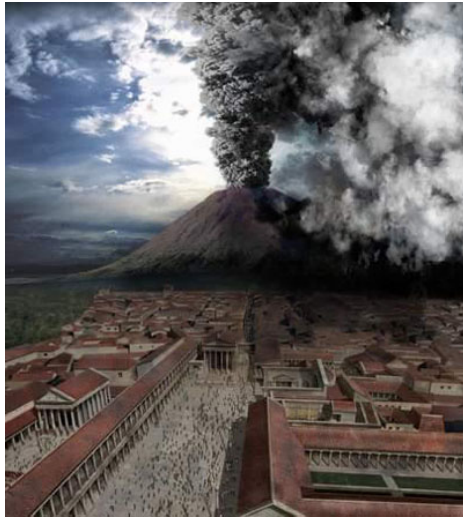
油画：庞贝火山喷发