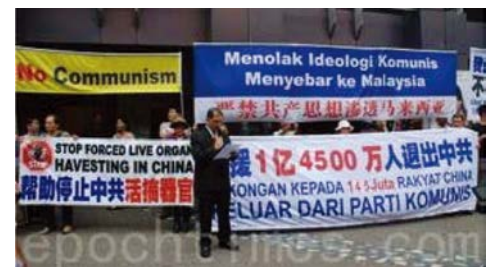
2013년 9월 8일 말레이시아 탈당센터에서 1억 4천 5백만 중국인의 ‘삼퇴’를 성원

공개적으로 중공의 당, 단, 대 조직에서 탈퇴해야만 독한 맹세를 없애고 자신을 위해 아름다운 미래를 선택할 수 있다.