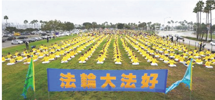
2013년 10월 20일, 2천여 명의 파룬궁수련생들이 로스앤젤레스 롱비치시 마리나 그린공원에서 단체연공을 하고 있다.

나의 부모는 똥굴면서 울었고, 가족 모두가 절망에 빠져 내가 살 수 있는 방법을 찾아 나섰다. 가족들은 모두 내가 백혈병이라는 것을 믿을 수 없다며 오진일 거라는 실낱같은 희망을 품고 웨