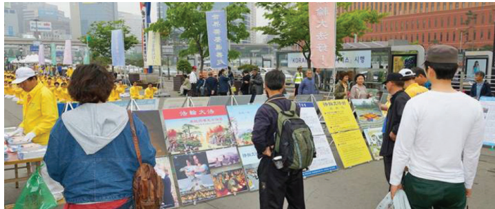
한국의 진상전시판 앞에서 파룬궁 박해 진상을 보고 있는 사람들

를 뜬 그 사람을 가리키면서 "저 사람이 바로 '610'책임자입니다."라고 했다. 나는 잠시 후 돌아 온 그 사람에게 "당신이 무슨 직책을 담당했는지 꼭 대법제자를 잘 대해 주어야 복을 받을 수 있습니다. 당신은 '610'의 많은 책임자들이 분분히 탈당한 것을 아시지요? 이미 많은 잘못을 저질렀다 해도 이 사건이 결속되지 않았기에 당신들에게는 모두 기회가 있습니다. 당신들은 이후 대법제자를 꼭 잘 대해 주어 공으로 잘못을 씻어야 합니다."라고 알려 주었다. 이윽고 그는 얼굴이 붉어졌고, 그들 셋은 결국 모두 '3퇴'를 했다.