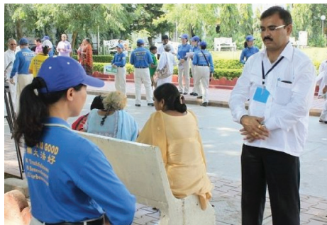
2013년 10월 초, 파룬궁수련생으로 구성된 천국악단이 인도 서부의 아마다바드시가 개최한 세계정신기공 축제의 초청을 받고 개막식에 참가했다. 천국악단은 공연과 동시에 파룬궁 5장 공법을 시연했다. 위 사진은 축제 참가자들이 파룬궁을 배우고 있는 장면이다.

[밍후이왕] 나는 모포 장사를 하는 사람이다. 2011년 11월 우연한 기회에 파룬따파(法輪大法)를 수련하게 되었다. 수련하기 전에 나는 타락한 사회 속에서 덩달아 향락을 추구하며 담배를 피우고 술을 마시고 도박까지 했다. 집도 아이도 돌보지 않고 도박만 하며 허송세월을 보냈지만 나는 기쁘지 않았다. 성미가 과격하고 집에서 유명한 여 패왕이어서 누구도 감히 나를 건드리지 못했다. 아이가 그때 5살이었는데 울면서 “엄마, 도박하러 가지 마세요.”라고 말하면 나는 “저리 비켜! 죽고 싶으냐?”라고 소리를 지르고는 여전히 하고 싶은 대로 했다. 매년 도박판에서 잃은 돈은 적으면 1, 2만 위안(한화 약 174만원~348만원)이고 많으면 7, 8만 위안(1,219만원~1,393만원)이었다. 장기간 마작을 하여 나는 건강관절주위염에 걸렸다. 나는 또 심한 위장병, 부인병, 자궁근종이 있었다. 한번은 나와 장사하는 친구에게