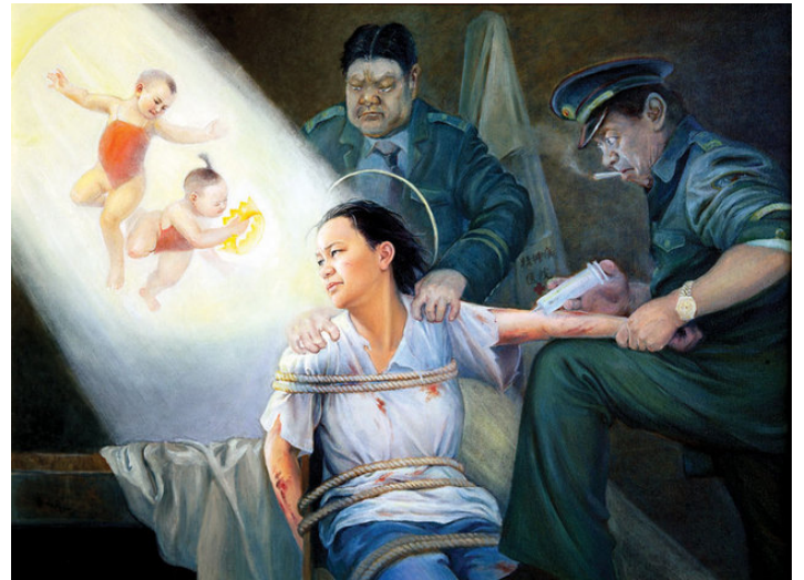
酷刑演示：打毒针（注射不明药物）（绘画）

有一次，在狱中做妇科检查，当我躺倒在床上时，不知她们（狱医）用了什么东西插入我的子宫后，立即听到“哗”的一声，血流到下边木桶里，立刻我什么也