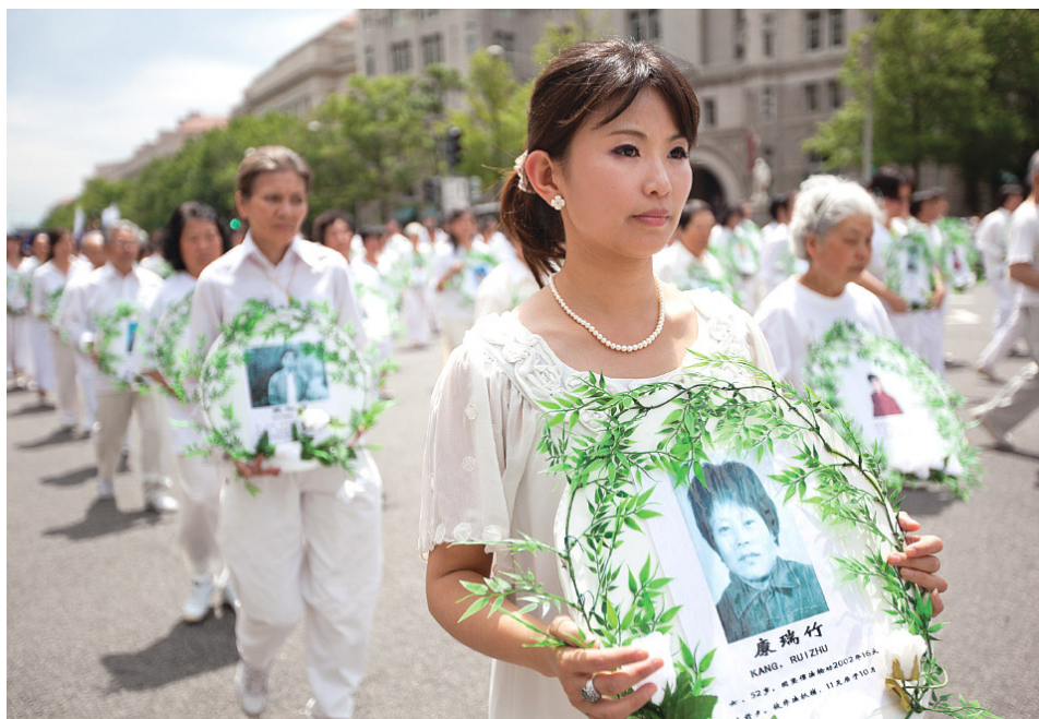
海外反迫害大游行，纪念被中共迫害致死的法轮功学员。