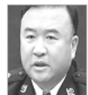
省公安厅 长王大伟