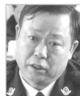
沈阳市公安 局长许文友