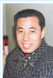
滑连友。左图为天津、山东民众的部分签名。