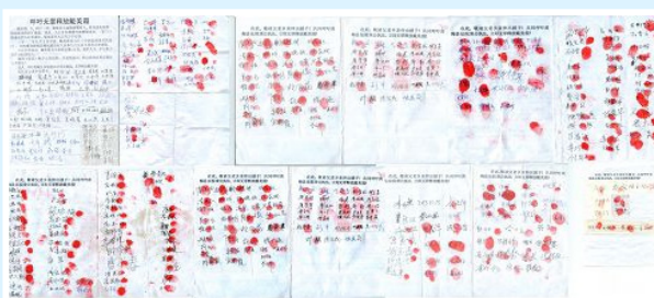
江西 373 名民众签名、按手印，要求释放戴美霞。

近日，600 多位湖北、江西民众签名、按手印，要求立即无罪释放戴美霞女士。这是继半年前黄梅县 2000 多位民众签名声援戴美霞之后的再一次民意展现。