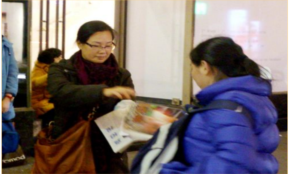
图：义工给购物的大陆游客派发真相资料

节日期间的游客特别多，这位法轮功学员自己带的二百多份真相报，不长时间就发完。有位游客好像是领队，提着所购物品，从商场出来看到她手里拿的资料便问道：“是法轮功的吗？”义工答道：“是呀，要看真实