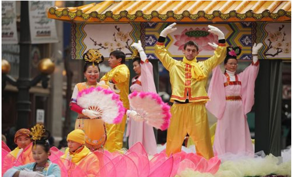
图片报道：二零一三年十一月二十八日，法轮功学员再度应邀参加了于芝加哥市中心举行的“麦当劳感恩节游行”，这也是他们连续第十年参加这个全美第二大的感恩节游行。图为法轮功学员在花车上演示功法。

义工说：汽车撞在金水桥栏杆上爆炸了，起了好大的烟火，围着一帮警察便衣，看着汽车烧得就剩个车架子，也没见一个灭火器。二零零一年，中共栽赃陷害法轮功的那个“天安门自焚案”，说烈火在“一分半钟”之内就被警察及时扑灭了。录像片里，着火现场，又是灭火器，又是灭火毯，都哪儿来的？不是事先有准备，广场上怎么会有这些东西？警察在前面慢慢悠悠救火，记者在后面抓紧拍摄，几个小时之内，由新华社向全世界发布消息，说法轮功学员在天安门自焚。这次的汽车爆炸，发生了二十个小时都没消息。两次着火，为什么