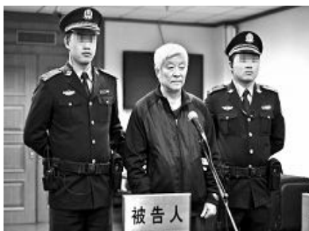
吉林省原副省长田学仁判无期

泽民，指使公、检、法、司和“610”恶徒对法轮功学员进行惨无人道的迫害，致死致残数百人，非法判刑、教养数千人，对法轮功学员犯下了滔天大罪。