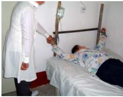
酷刑演示：打毒针（注射不明药物）

我把此事告诉了狱警，说：“你们给我放的那个东西掉下来了。”不久，恶人又劫持我，想再给我放一个，我不愿再遭受那种痛苦的折磨，拼命