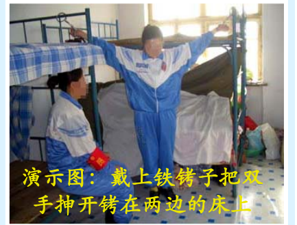
演示图：戴上铁铐子把双手抻开铐在两边的床上