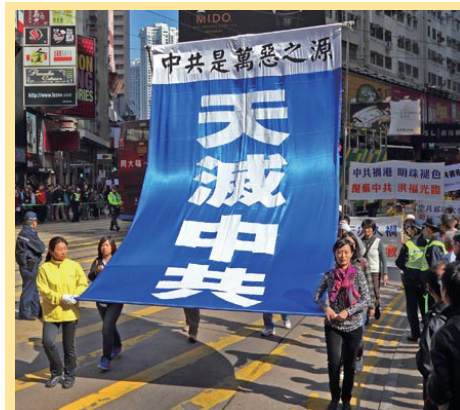
二零一三年十一月三十日，香港法轮功学员及支持团体，举行“声援三退、反迫害”的集会和游行活动。