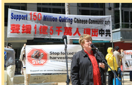
二零一三年十一月三日，澳洲墨尔本举办集会，庆贺并声援 1.5 亿中国民众退出中共党、团、队。◇

克思呀？”有人会说“那是‘逗你玩’，说着玩的，不必当真”。但这种话可不是“逗你玩”的，也不是让你“说着玩”的，那是和你入党、入团、入队时“把一切献给（恶）党”，“为（邪恶）共产主义奋斗终生”一类的毒誓挂着勾的，你不三退，真得去见马克思。哪儿见？地狱。这不是开玩笑！还没正式声明退出中共、退出中共附属组织的好人，还是赶快退出来为好。不然，到时候，那马克思，你想见不想见，都得去见，由不得你。选择的时机，就是现在，也只是现在，天灭中共之前的现在。时间很有限了，错过可就太可惜了。◇（文／伍新）