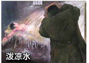
法轮功学员所遭受的部分酷刑