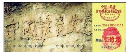
标示“中国共产党亡”的藏字石门票

迫害法轮功中，中国社会法制全面倒退、道德全面败坏、国家资源被全面滥用。如果人类抛弃了普世的价值，用中共践行的“假、恶、斗”肆无忌惮地践踏人类的道德良知，人类世代相传的善良与美好就会被中共独裁统治诠释出的“假、恶、斗”的魔性所替代，那人间哪有美好可言？◇