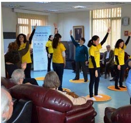
土耳其法轮功学员向老人们介绍法轮功并演示功法

【明慧网】二零一三年二月二日，土耳其法轮功学员来到伊斯坦布尔市的一家养老院，向那里的人们介绍法轮大法的美好。这家以“慈善”（Sefkat）命名的养老院，是伊斯坦布尔市巴克科伊区（Bakirkoy）政府于二零零三年建立的半公立便民慈善项目，其完善的设施和周到的服务，十年来赢得了社会各界的赞誉。