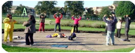
图 A: 剑桥大学学生; 图 B: 欧洲 12 所学校 800 名师生在炼法轮功; 图 C: 美国佛州大学学生; 图 D: 台湾学生; 图 E——H: 为印度众多学校学生在炼法轮功。

法轮功的主要著作《转法轮》中的首页文章——《论语》英文版被列入印度学校的教材中。