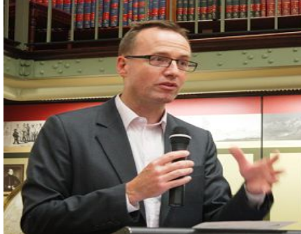
澳洲纽省立法会成员、绿党司法事务发言人舒布瑞杰先生

他还谈到中共利用国家机器与政权系统联手,系统地在全球贩卖器官,一旦澳洲人接受这样的器官进行