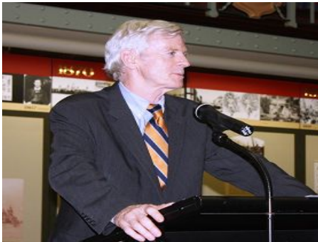
加拿大前亚太司司长大卫·乔高