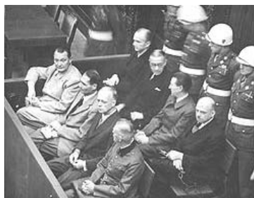
图：纽伦堡审判图片。

最后的证据，就是“一线人员”错误运用法律，侵犯了法轮功学员的合法权利。然后其党再叫嚣，这些一线执法人员损害了“党”和国家的形象、给“建设事业”造成了巨大损失，云云。那些参与迫害法轮功的人员可能没有想到，中共在迫害法轮功的过程中，早把他们当成随时可以抛弃的棋子。◇