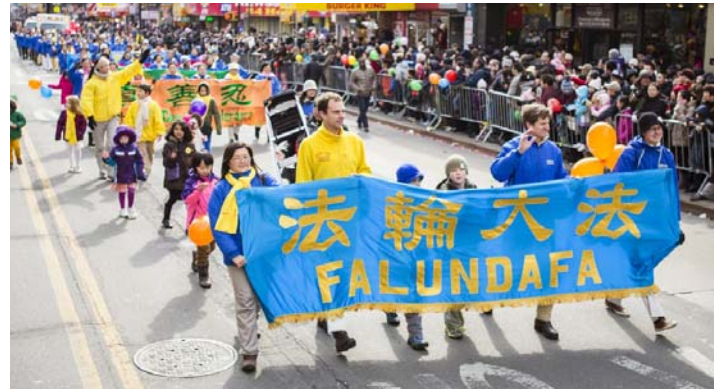
图: 法轮功学员参加纽约法拉盛华人新年游行