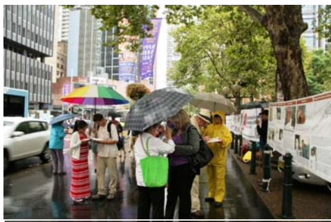
悉尼部份法轮功学员冒雨在市政厅大楼前举办征签

今天下雨，但无论如何都得赶过来，因为这对每个人的生命来说都是很重要的，如果今天你不站出来制止，不知道哪一天这种事情会发生在自己身上，大家都应该把它当作份内的事情去做。今天虽然下着大雨，但很多人走过来签名声援。