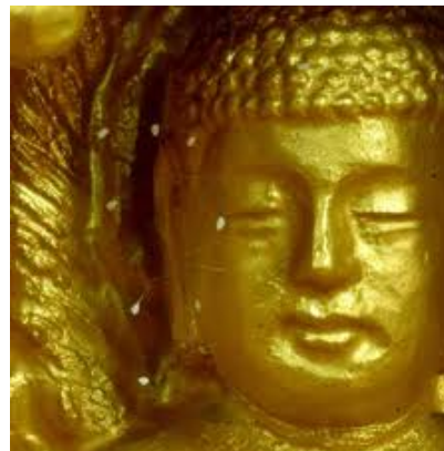
韩国须弥山禅院，菩萨像面部首次呈现十朵 ... 优昙婆罗花

千百年来，无数的修道人都在等待这一天的到来，却不知道法轮圣王何时何日来世间传法度人。现在优昙婆罗花在人间已经开了，圣王已来到人间，法轮大法正在全世界范围内洪传。遗憾的是很多人由于种种原因，不知道优昙婆罗花已开，更不知道法轮圣王已来在我们的身边。还有甚者听信中共邪党的谎言，无端地仇视法轮大法，多么令人悲哀啊！