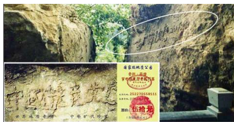
左下小图为风景区门票

这块“亡共石”是神在警醒世人，天要灭它了。有识之士赶快远离中共，以免天灭中共时被殉葬。◇