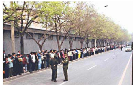
图为 1999 年 4 月 25 日，上万名法轮功学员在国务院信访办和平上访。