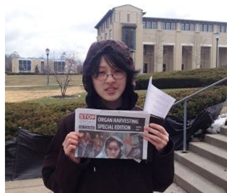
卡内基大学华裔学生声援反迫害。

有的人对法轮功学员表示：感激你们，我相信你们，愿上帝保佑你们。有的人说，谢谢你们让我知道什么是法轮功，为什么法轮功受迫害。有的人说，如果大家都来练习法轮功，那么这个世界不就变得很美好吗？◇