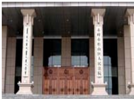
图：赤峰松山区法院

蕾遭邪党的迫害，被迫流离失所九年，前后三次被绑架、关押，第三次被绑架是在二零一二年七月末八月初。