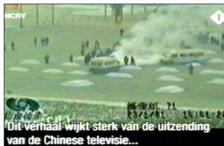
图: 荷兰国家电视一台 2005 年 3 月 14 日《时事评论》节目揭露天安门自焚伪案, 质疑突发事件中两辆警车为何备有 (据中共报导) 20 多个灭火器。国际教育发展组织 2001 年 8 月 14 日在联合国会议上声明: 自焚事件是政府导演的。中国代表团面对确凿证据, 没有辩辞。

辜的士兵在朝鲜战场、越南战场被打得尸横异邦, 可是在国内对手无寸铁、打不还手骂不还口的善良法轮功学员, 却如此耀武扬威, 悲哉! 怪哉!