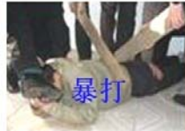
图片说明：中共劳教所内的种种酷刑

们都不敢说是马三家的，因为把十八个女法轮功学员扒光衣服投入男监就是马三家劳教所干的。