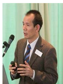
医学专家 Huige Li 教授