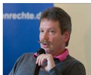
作家阿斯巴赫先生