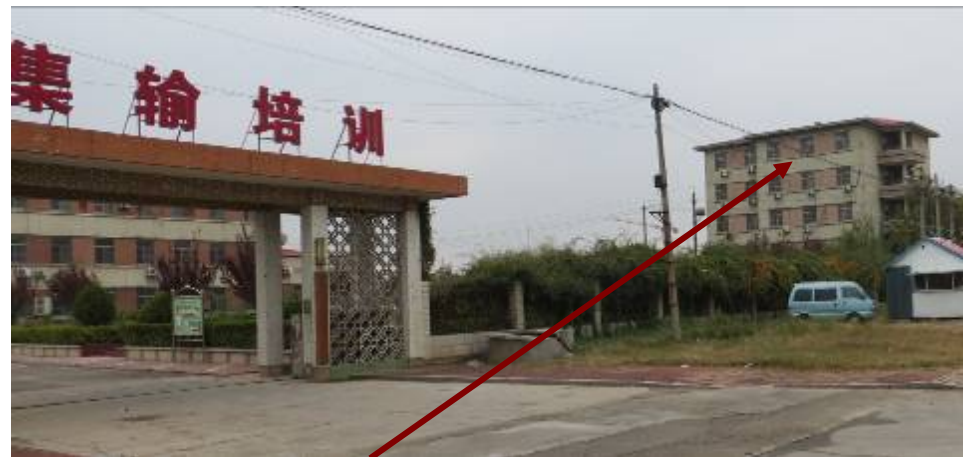
位于胜利油田集输培训学校宿舍楼的洗脑班所在地

洗脑班是中共“六一零”迫害法轮功的非法机构。信仰自由是《中国宪法》赋予中国公民的基本权利。法轮功是佛家上乘修炼大法，以“真善忍”为修炼原则。在中国没有任何一条法律说法轮功是违法的，中共对法轮功的迫害一直是“以权代法”，是中共在破坏法律实施。◇