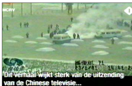
图: 荷兰国家电视一台 2005 年 3 月 14 日《时事评论》节目揭露天安门自焚伪案,质疑突发事件中两辆警车为何备有(据中共报导)20 多个灭火器。国际教育发展组织 2001 年 8 月 14 日在联合国会议上声明:自焚事件是政府导演的。中国代表团面对确凿证据,没有辩辞。

无辜的士兵在朝鲜战场、越南战场被打得尸横异邦,可是在国内对手无寸铁、打不还手骂不还口的善良法轮功学员,却如此耀武扬威,悲哉!怪哉!