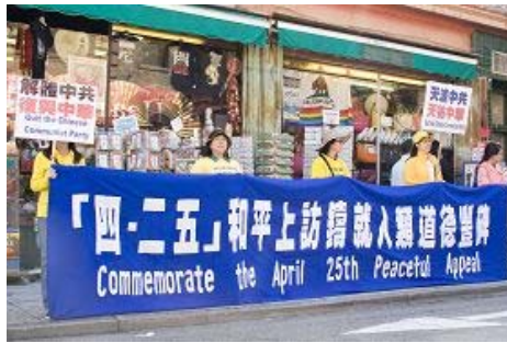
图片: 法轮功学员在街道拉起横幅

四月二十一日,旧金山阳光明媚、风和日丽,中国城的行人和游客不断,法轮功学员在花园角广场的炼