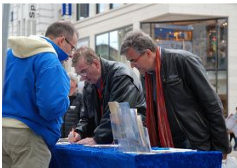
汉堡市中心人们签名支持法轮功反迫害

这一天，汉堡在经过前段时间的反季节不正常寒冷后，变得暖和而晴朗。在汉堡市中心著名购物大道处子堤上，在阿斯特湖畔，法轮功学员在展位上挂起三个真相横幅，主题是纪念四·二五和平请愿、介绍什么是法轮大法、以及揭露中共迫害法轮功和活摘法轮功学员器官的真相。当地学员展示着法轮功功法，以模拟演示揭