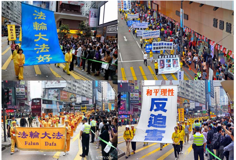
图片说明：浩浩荡荡的游行队伍吸引广大民众，纷纷拍照。

四年来对法轮功学员的残酷迫害，他说：“很多人不愿意放弃法轮功而被拘留、被殴打甚至是被虐待，更甚的残害是被摘取他的器官来贩卖，这个是极不人道和残忍的行为，我相信任何文明的社会都是不齿的。”何俊仁指出“青年关爱协会”（简称青关会）对法轮功真相点极尽滋扰、挑衅，甚至暴力行为的不对，他表示非常关心，并且相信这是中共背后撑腰，何俊仁说：“我已再三和警方讲，如果还有这样