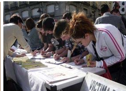
▲ 2013 年 4 月 2 日上午，西班牙法轮功学员在驻西中使馆前举行纪念“四·二五”北京和平上访十四周年活动。前来签字声援法轮功反迫害的民众络绎不绝