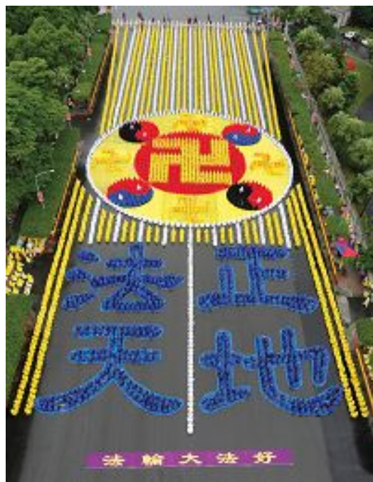
▲ 2012 年 11 月 17 日，台湾五千名法轮功学员在总统府前的广场上，排出“法正天地”及法轮功的标志法轮图形，场面宏伟壮观

借着“四·二五”事件而听闻法轮功的国际社会，在其后的十四年里，因法轮功学员坚持不懈地讲清真相，而越来越了解法轮功。如今，法轮功已经弘传至世界一百多个国家和地区，上亿人因修炼法轮功而身心受益。