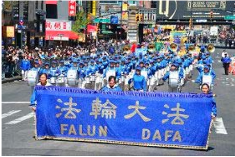
图片：法轮功学员的游行队伍

(明慧记者采菊纽约报道)二零一三年四月二十七日中午, 星期六, 大纽约地区的部份法轮功学员与支持民众在纽约法拉盛举行大游行, 纪念十四年前逾万名法轮功学员北京国务院信访办四二五和平上访, 呼吁各界制止中共对法轮功的迫害。