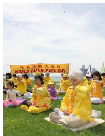
图（依序）：台湾大法弟子游行庆祝大法日；美国华盛顿 DC 法轮功小弟子们；美加边境的底特律河畔集体炼功