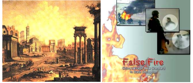
上图：公元 64 年 7 月，尼禄纵火罗马城，嫁祸基督徒。