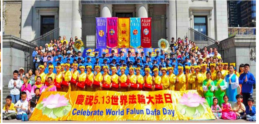
图：澳洲墨尔本法轮功学员五月十一日集体炼功